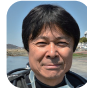
武本匡弘 (プロダイバー/環境活動家)