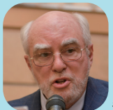
ジョゼフ・ガーソン (平和・軍縮・共通安全保障 キャンペーン議長/アメリカ)