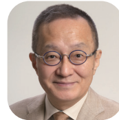
笠井 亮 (日本共産党衆議院議員)