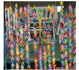
碧南の高校生による折り鶴