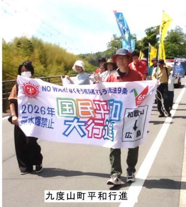
九度山町平和行進