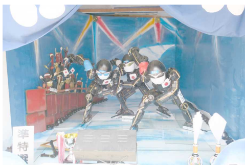
↑【平田一式飾り】 ↓【出発式】

今年の行進は、昨年よりはるかに気温が高く、みなさん汗びっちょりになりながら行進していました。署名活動では、涼しいお店を狙ってはいったり、コーヒーを出していただいたり、それぞれ考えながら署名活動していました。