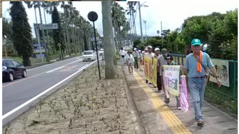
上天草市のサンパールからの行進の様子。