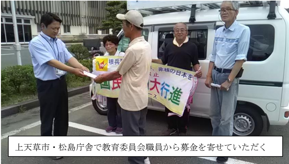
上天草市・松島庁舎で教育委員会職員から募金を寄せていただく