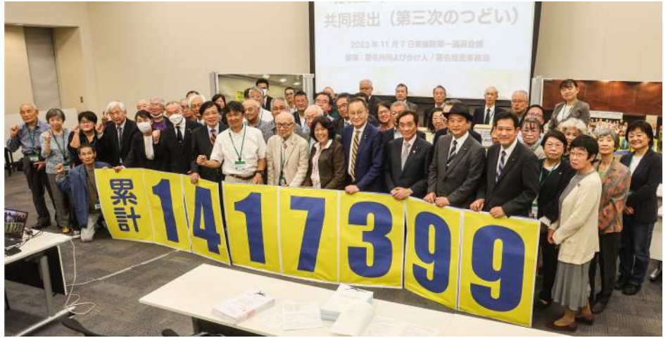
2023年11月7日、衆議院議員会館で署名の「共同提出のつどい」を開催。衆参国会議員、被爆者、市民団体の代表が参加。

みなさんの署名は、個人情報の適正な保護・取り扱いのもとで、すべて日本政府に提出します。