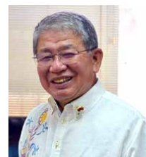
赤嶺 政賢 さん