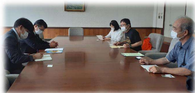
始良市での懇談とスタンディング