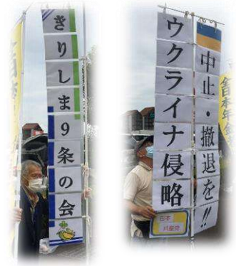
霧島市のコープ国分店前で21人がスタンディング。手作りののぼりで平和を訴える