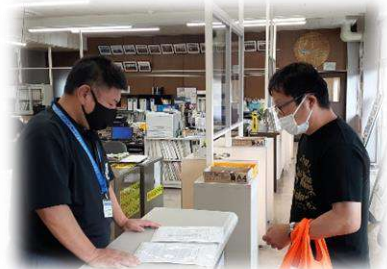
湧水町で署名などを手渡す