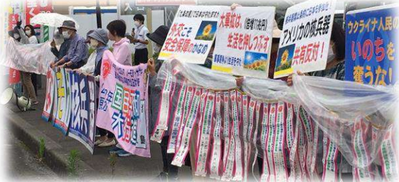
霧島市のコープ国分店前で21人がスタンディング宣伝