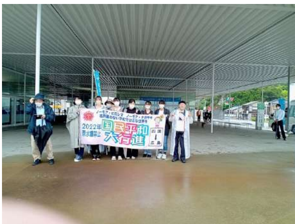
宮浦港での出発式