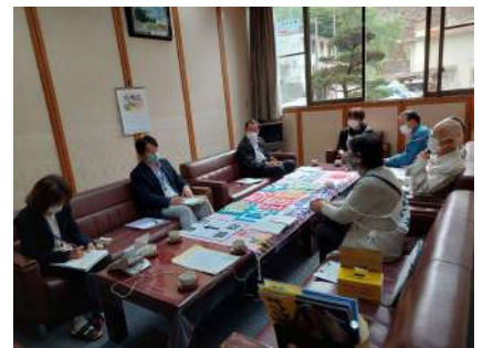
参加者と町長らに要請する