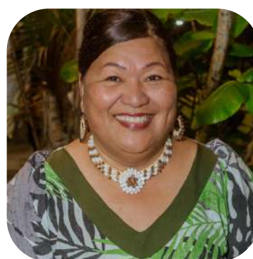
アバッカ・アンジャ イン・マディソン