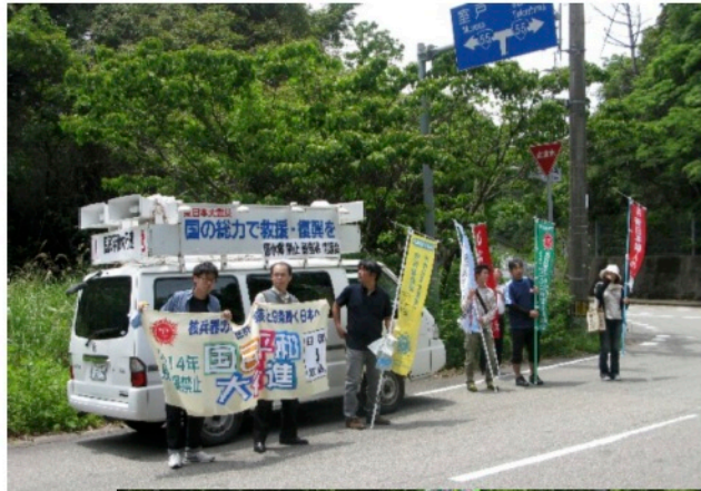
5月18日 日 高知県甲浦にて 徳島県への引き継ぎ式を行いました。