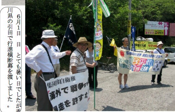
6月1日 日 とても暑い日でしたが香 川県の引田で行進横断幕を渡しました。