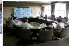
鳴門市での参加者の皆さん

各自治体から力強い 励ましのお言葉を頂き ました。議会事務局・ 総務課の方、忙しい中 要請行動・平和行進に 参加して下さいました多 く