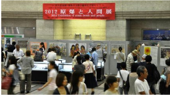
2012 原爆と人間展 2012 EXHIBITION OF atomic bomb and people

日本一の原爆展」として 県原爆被災者の会 県生協連の主催で、八月二十四日から二十七日まで開催された「原爆と人間展」には、四日間で一萬三千人が訪れました。 会場が横浜駅東口そごう前広場であったこともあり、連日、多くの市民が訪れました。午前十時から午後八時までの開催でしたが、午後八時になってもたくさんの方が観ている状況が連日続きました。県原水協は、協賛団体として成功のためがんばりました。 この大規模な「原爆展」を成功させるため、被爆者をはじめ、主催団体協賛団体など四日間で延べ二五〇人を超える人がスタッフとして連日奮闘しました。 被爆者話し込む場面、メッセージカードに思いを書く人、募金を寄せる人など多く見られました。神奈川大学の学生が担当したDVD上映コーナーでは、二十数席の座席は鑑賞する人が、いつもいっぱいでした。 この人間と原爆展は、九回目を迎えましたが、被爆の実相を伝え、核兵器廃絶の世論を広げる力となりました。