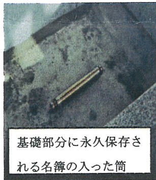
基礎部分に永久保存される名簿の入った筒

(募金は、19市区町から284人、24団体・企業・法人のご協力がありました。繰越金の利用は検討中です。)