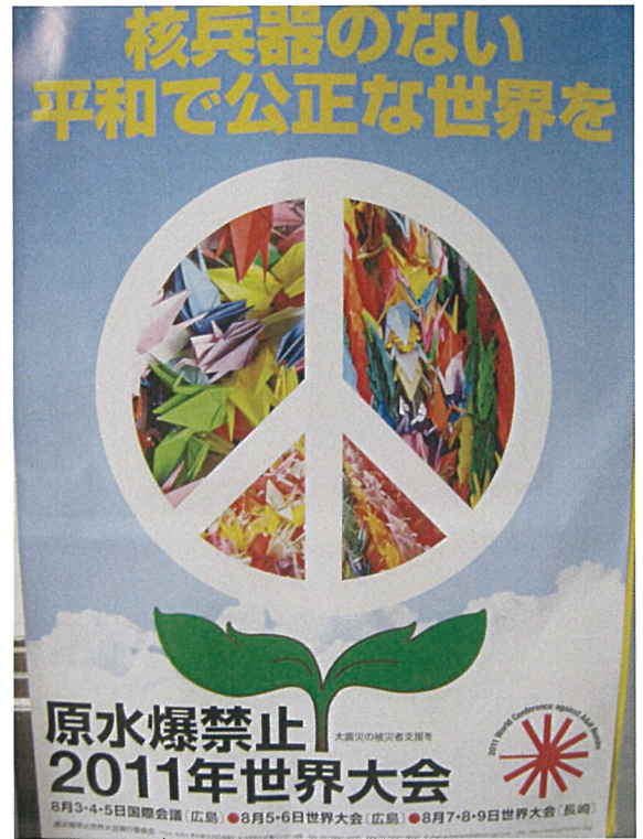
世界大会ポスター 1枚100円