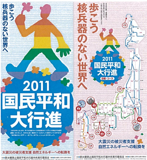
平和行進ステッカー 2枚1組 100円

世界大会の学習に欠かせないパンフ。原発問題も載っています。職場・地域学習にぜひ。