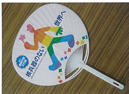
平和行進うちわ 1本150円